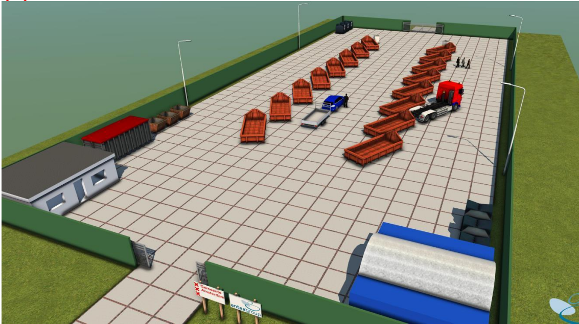
Schetsontwerp tijdelijk afvalpunt

Stankoverlast wordt voorkomen doordat er op de tijdelijke locatie een kleiner aantal afvalsoorten worden verzameld dan op de Cruquiusweg. Dat zijn de hoofdstromen afval, zoals hout, ijzer en plastic, inclusief klein chemisch afval. Ook is er de mogelijkheid om glas, papier en textiel in te leveren. Wat er niet gebeurt is de stort van ingezameld grofvuil uit de stadsdelen en het overslaan daarvan met kranen. Er wordt ook geen veeg- en prullenbakkenvuil uit de stad verzameld en daarmee wordt stank voorkomen.