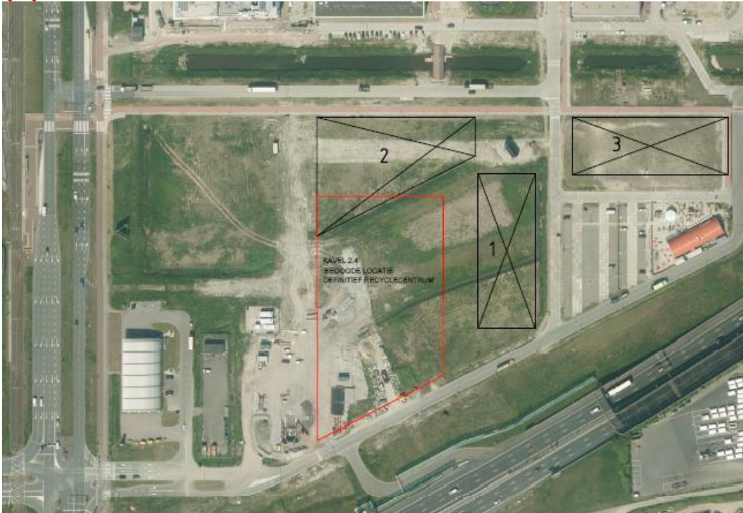
Mogelijke locaties tijdelijk afvalpunt. In het rode kader de locatie voor het recyclepunt kader